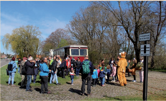
Der Osterhase wartet auf unsere kleinen Fahrgäste