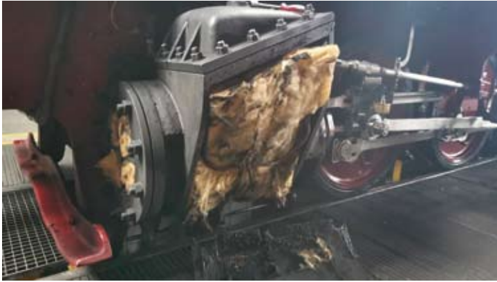
Im Zuge der Kesselprüfung an Dampflok HOYA wurden auch andere Bauteile geprüft und bearbeitet, wie hier die freigelegte Zylinderisolierung. Februar 2021, Bruchhausen-Vilsen.