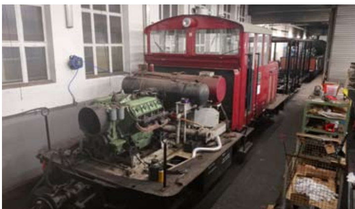
In die Werkstatt nach vorn geholt wurde auch Diesellok V 29: Die demontierte Motorhaube deutet auf Vorarbeiten für eine Wiederinbetriebnahme hin. Bruchhausen-Vilsen, 28. Januar 2021.