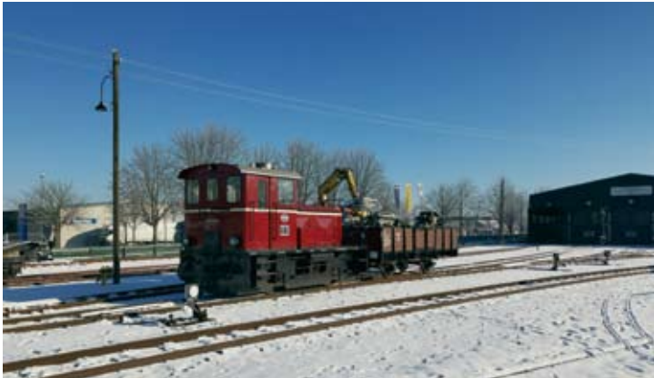
Am 31. Januar 2021 präsentierte sich der Bahnhof Bruchhausen-Vilsen nach Jahren mal wieder unter einer dicken Schneedecke, als Diesellok V 3 mit O-Wagen 141 rangierte.