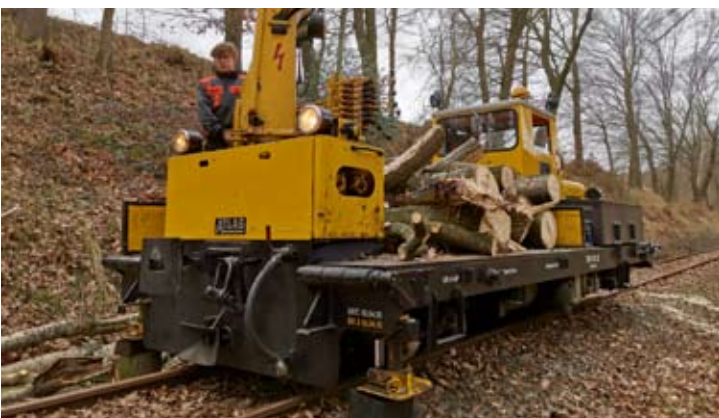
Der Skl entpuppt sich mit seinem Greifarm und seiner Ladefläche einmal mehr als Universalgerät für die Streckenunterhaltung. Vilser Holz, 28. Februar 2021