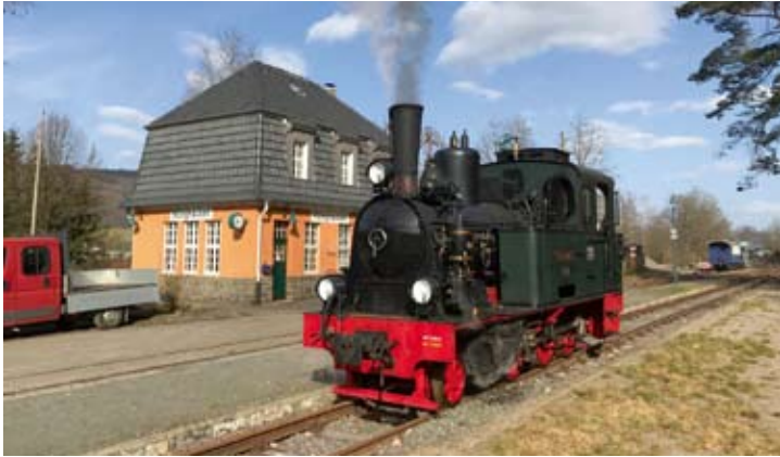
Dampflok SPREEWALD hat bei der Märkischen Museums-Eisenbahn eine HU erhalten und darf wieder eingesetzt werden. Hüinghausen, 25. Februar 2021.