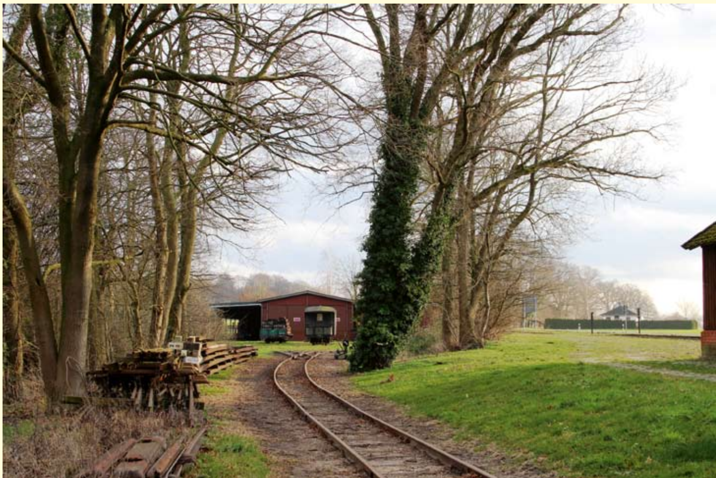
Winterliches Stillleben im Heiligenberger Grund. Das Anschlussgleis im Vordergrund zur Fahrzeughalle wurde im Frühjahr zu großen Teilen saniert. Mehr dazu in der nächsten DME. Heiligenberg, 23. Januar 2021