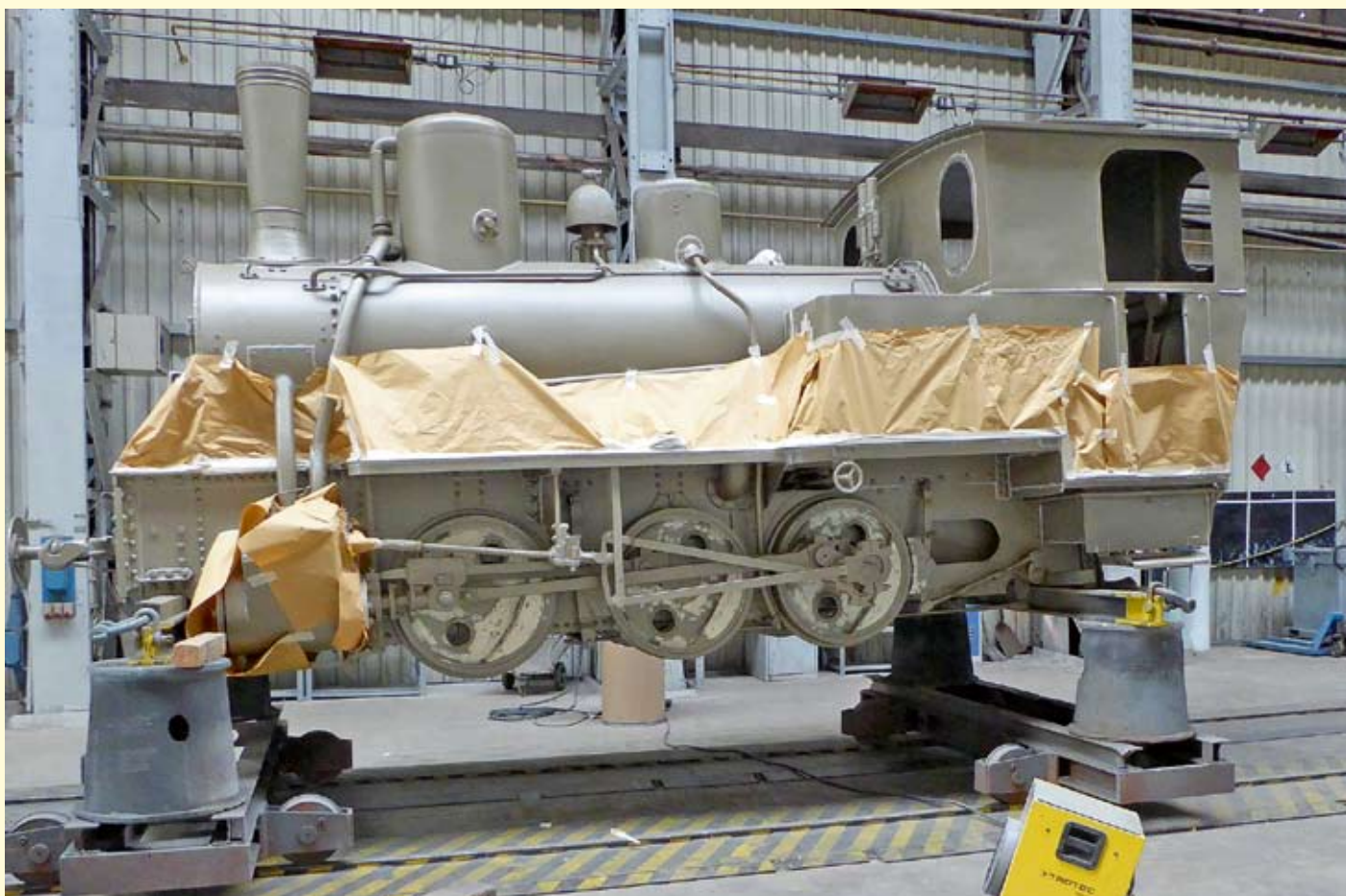
Fast wie ein abstraktes Kunstobjekt wirkt die silbern vorgestrichene und teilweise abgeklebte Denkmallokomotive JOHANN REINERS am 28. April 2021 in einer Bremer Lackierwerkstatt: Zum Zeitpunkt der Aufnahme wurden gerade die Kanten und Unebenheiten abgedichtet. In Kürze steht sie wieder in Grün, Schwarz und Rot lackiert auf dem Sockel in Bremen-Findorff.