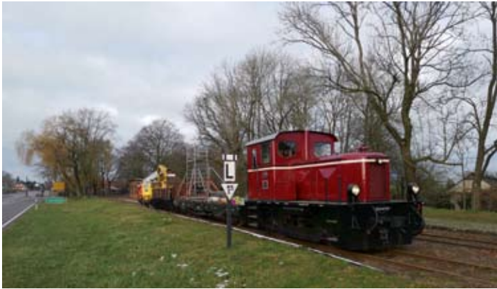
Am 9. Januar 2021 nutzte die Gleisbaurotte einen Güterzug mit Diesellok V 3 für den Streckenfreischnitt, hier beim Halt in Heiligenberg.