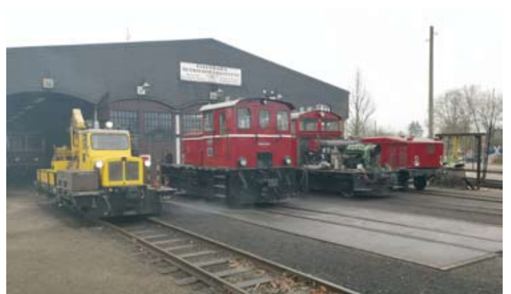
Dieseltriebfahrzeugparade bestehend aus Skl 1 „Friedhelm“ und Dieselloks V 3 und V 29 (plus separater Motorhaube). Bruchhausen-Vilsen, 28. Januar 2021.