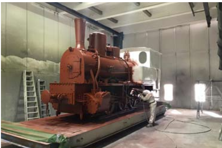
In verschiedenfarbigen Lagen wird Haftgrund aufgesprüht, damit man sieht, wo die Farbschicht noch nicht vollständig ist. Bremen, 3. März 2021.