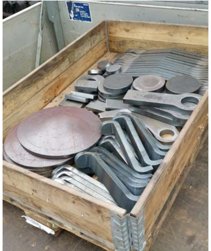
Neue Teile für den Nachbau von sechs Außenbalancier-Mittelpufferkupplungen sind in der Werkstatt eingetroffen. Bruchhausen-Vilsen, März 2021.