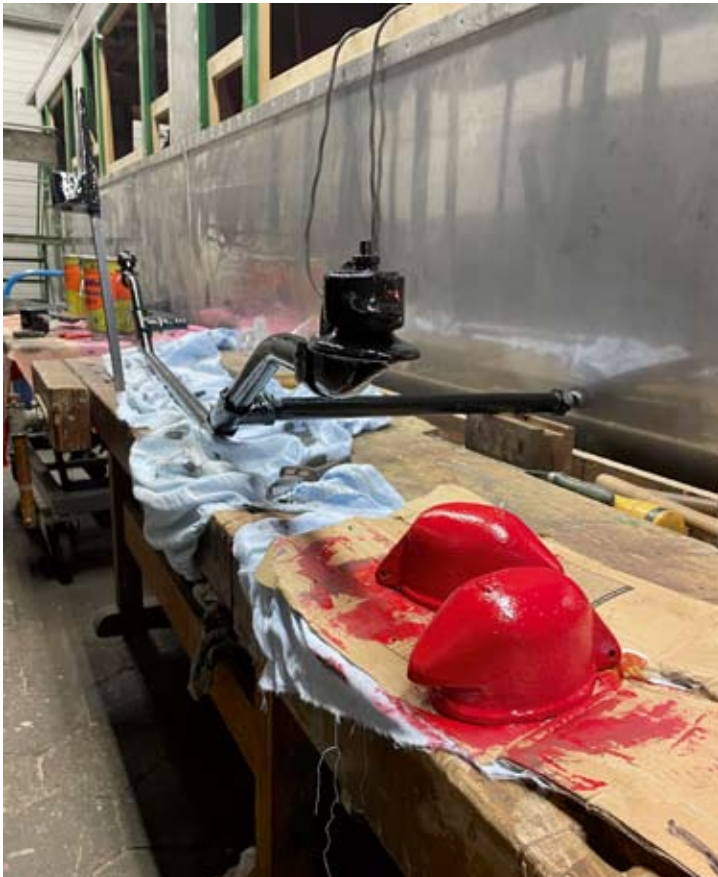
Die Arbeiten am Aufbau von Wagen 7 werden in Heftmitte vorgestellt. Für das Fahrwerk werden derweil die Teile der Hardy-Saugluftbremse rekonstruiert. Bruchhausen-Vilsen, März 2021.