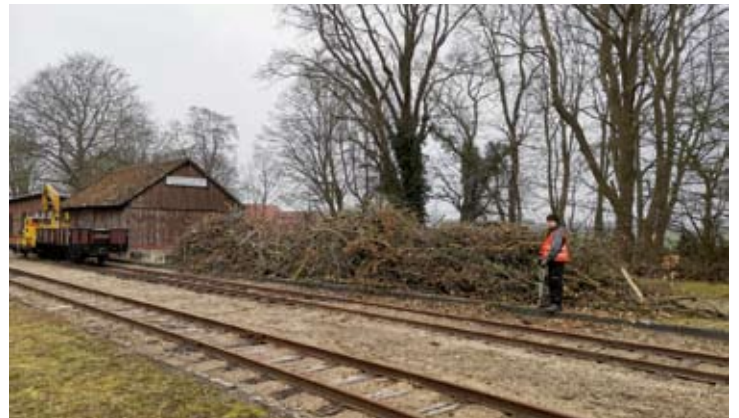
Die Ausbeute kann sich sehen lassen: Die Ladestraße am Bahnhof Heiligenberg ist voll mit Astschnitt. Leider konnte er dieses Jahr nicht standesgemäß dem Osterfeuer zugeführt werden... 28. Februar 2021