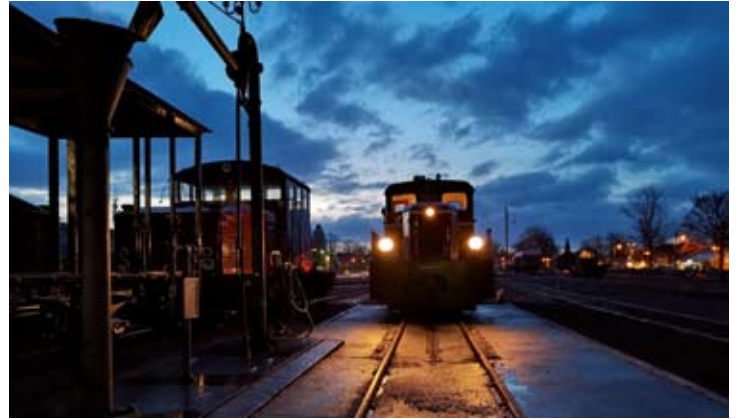
Abendliches Stelldichein vor dem Werkstatttor mit Dieselloks V 3 und V 29. Bruchhausen-Vilsen, 26. Januar 2021