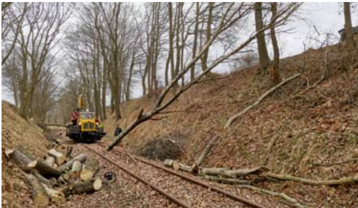
Ende Februar war der Schnee wieder geschmolzen, und es wurde dem Gehölz im Einschnitt am Vilser Holz grundlegend zu Leibe gerückt. 26. Februar 2021