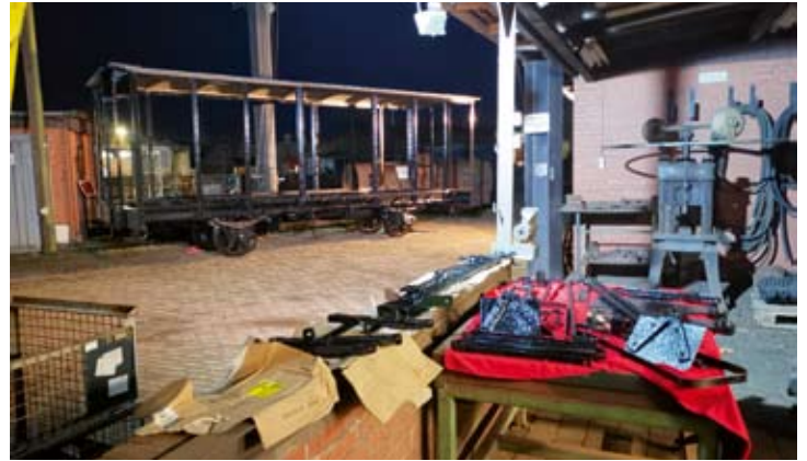
Am 14. Januar 2021 ist das Stahlgerippe von Güterwagen 129 neben der Werkstatt fertig lackiert, und die Teile der Bremsanlage können wieder eingebaut werden.