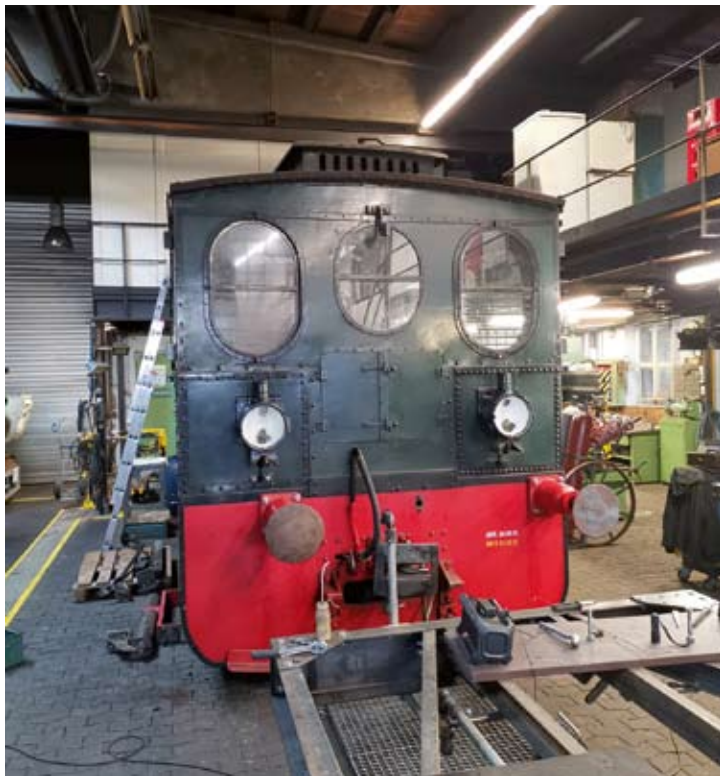
Testweise erhielt die Dampflok PLETTENBERG ihre asymmetrisch angeordneten Normalspurpuffer zurück. Bruchhausen-Vilsen, März 2021.

Seit Ende März 2021 wird in einem Bremer Beschichtungsfachbetrieb an dem neuen Außenanstrich der Denkmalslokomotive JOHANN REINERS gearbeitet. Im Zuge dieser Arbeiten wurde die Lokomotive von allen Seiten im Sandstrahlverfahren von alten Anstrichen und Korrosionsschäden befreit. Deshalb konnte man die Lokomotive für kurze Zeit in einem gewissermaßen metallisch blanken Outfit fotografieren. Auch der Satz „von allen Seiten“ ist wörtlich zu nehmen: Eine Denkmalslokomotive, die auf einem Sockel steht, muss natürlich auch von unten ansehnlich aussehen. Deshalb haben die Fachleute auch vor der Unterseite der Lok nicht Halt gemacht und auch diese Seite entsprechend bearbeitet. Wenn alles nach Plan so weiterläuft, sollen die Lackier- und Konservierungsarbeiten noch im Mai 2021 abgeschlossen sein. Wann die Denkmalslokomotive dann wieder auf ihren angestammten Standplatz in Bremen-Findorff zurückkehren wird, ist zur Zeit noch offen.