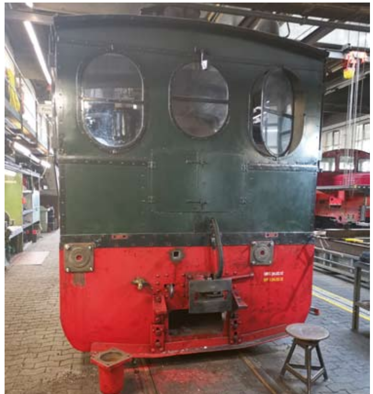
Am anderen Lokende musste das Quereisen an der Pufferbohle für die Normalspurpuffer ausgeklinkt werden. Bruchhausen-Vilsen, März 2021.

Wann es aufgrund der anhaltenden Entwicklung der Coronapandemie und den damit verbundenen Einschränkungen wieder möglich sein wird „normal“ zu arbeiten, ist im Moment nicht absehbar. Deshalb informieren Sie sich bitte in diesem Zusammenhang auf der DEV-Homepage im Internet über die aktuellen Entwicklungen, bevor Sie vielleicht den Weg nach Bruchhausen-Vilsen vergebens antreten.