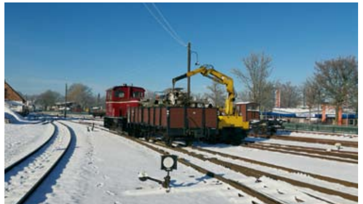
Mit Hilfe des Skl 1 „Friedhelm“ wurden bei bestem Winterwetter Dieselmotoren umgeladen. Bruchhausen-Vilsen, 31. Januar 2021