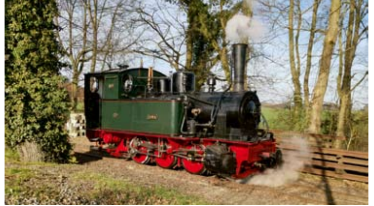
Dampflok HOYA am 25. Februar in Heiligenberg bei Probe- und Einstellungsfahrten anlässlich der erfolgreichen Kesselprüfung.