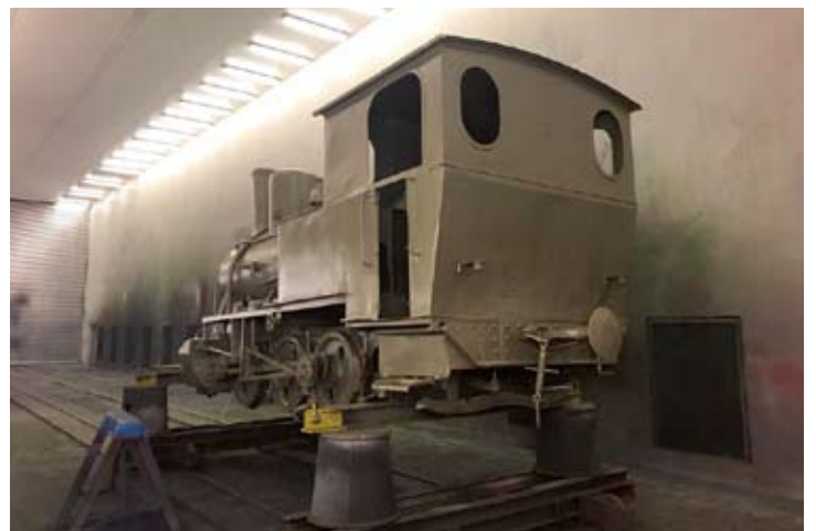
Zuletzt erhält die 1899 von Hanomag unter der Fabriknummer 3345 gebaute Lok einen silbernen Voranstrich. Bremen, 15. April 2021.