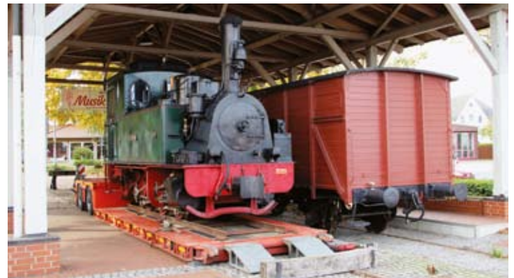
HERMANN wohlbehalten zurück vom Ausflug aus dem Sauerland: Unter der Umladehalle in Bruchhausen-Vilsen angekommen, fehlten nur noch die Gleisejoche zum Abladen. 7. Oktober.