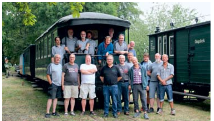
Erinnerungsfoto der Spur-0-Modellbahner in Heiligenberg vor der „großen Kleinbahn“ – vielen Dank! 4. August 2019.