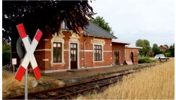
Auch auf der Gleisseite zeigte sich der ehemalige Bahnhof Bruchhausen Ost im restaurierten Zustand.