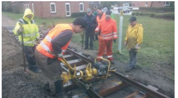
Gearbeitet wird auch bei schlechtem Wetter (auch wenn die meisten hier gerade zuschauen): Montage des ersten neuen Gleisjochs in Asendorf. 9. Oktober 2019.