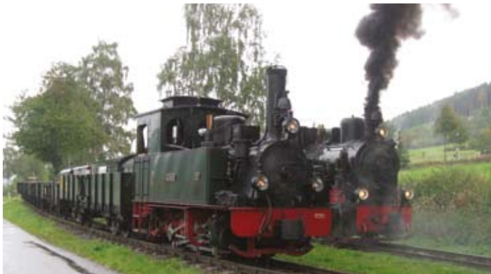
Trotz schlechtem Wetter ein voller Erfolg: HERMANN mit Wim Paters OEG-Wagen zu Gast in Plettenberg. Zugbegegnung am Hp Seissenschmidt mit Dampflok BIEBERLIES. 6. Oktober 2019.