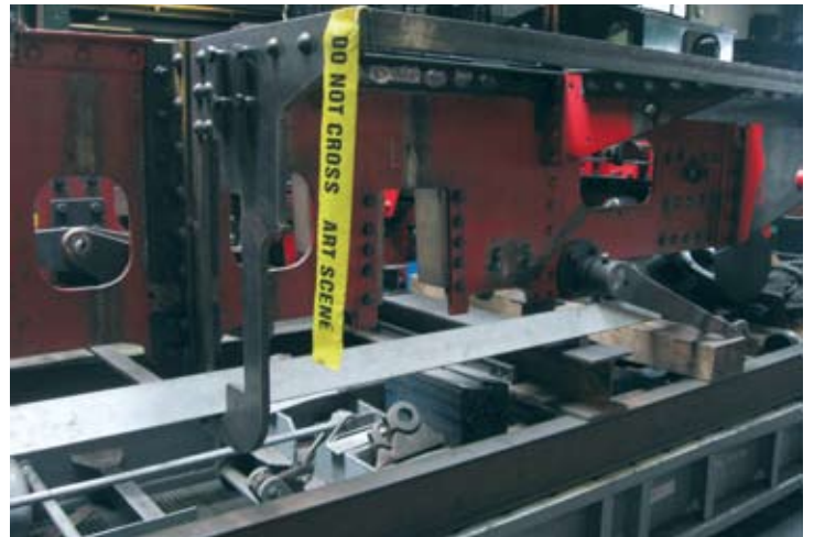
Bleche und Winkel werden erst mit Passschrauben fixiert und dann angenietet. Auch das Bremsgestänge ist bereits teilweise montiert. Bruchhausen-Vilsen, 27. September 2019.