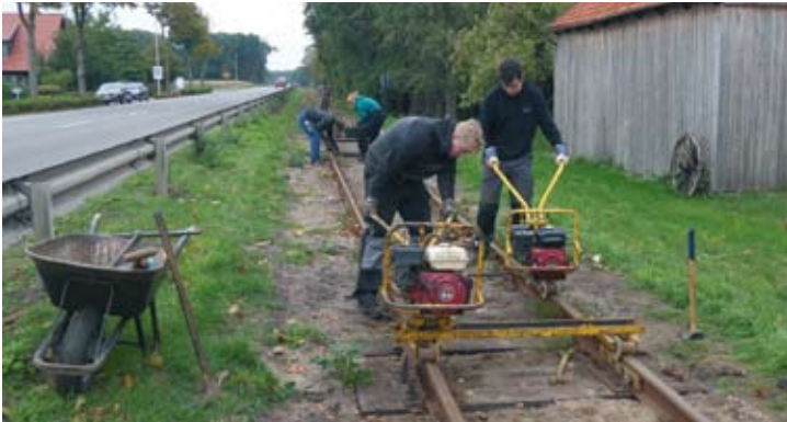
Am Ortseingang von Asendorf befindet sich der zweite zu erneuernde Gleisabschnitt: Lars und Nils Böcker beim Losschrauben der alten Schwellenschrauben. 8. Oktober 2019.