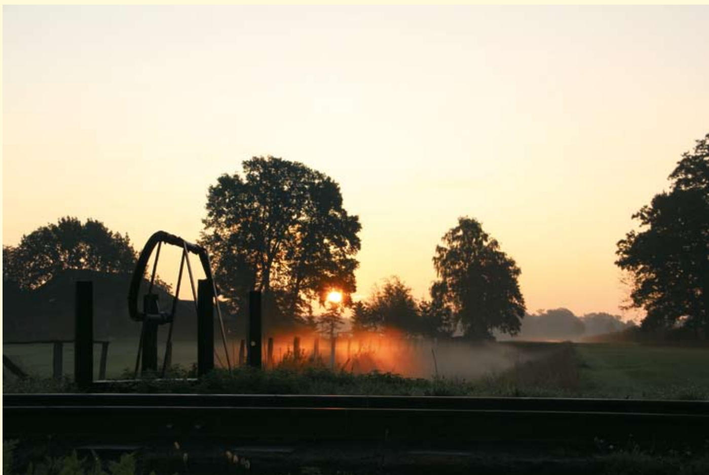
Frühmorgens an der Kleinbahn: Der herbstliche Sonnenaufgang an der Strecke versprach einen schönen Tag! Bruchhausen-Vilsen, 5. Oktober.