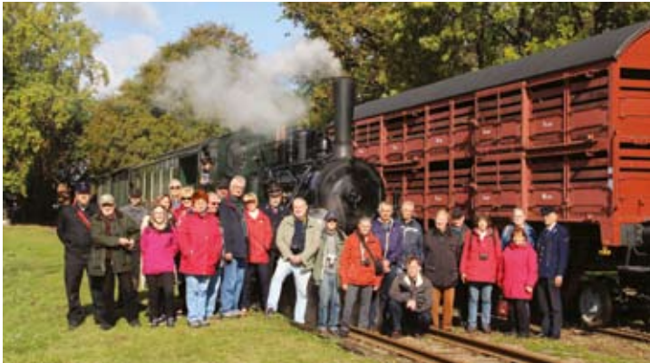
Bei strahlendem Sonnenschein im Bf Heiligenberg entstand das Gruppenfoto der Sonderfahrt der Eisenbahnfreunde Hannover zum 60sten Jubiläum: Herzlichen Glückwunsch!