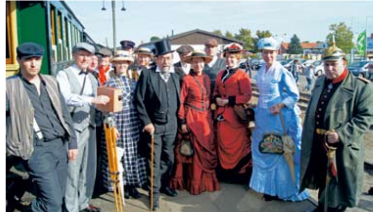
Stilvoll und passend zum Historischen Wochenende, das das Leben vor 100 Jahren auferstehen ließ, so zeigten sich viele gut betuchte Reisende am Bahnhof in Bruchhausen-Vilsen, 14. Sept. 2019.