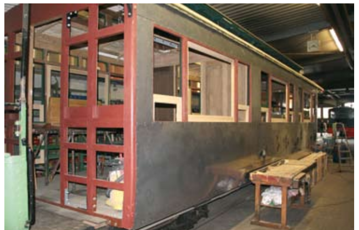
In der DEV-Wagenwerkstatt macht die Restaurierung von DEV-Wagen 16 Fortschritte, ein Teil der Verblechung war bereits montiert. 4. Oktober 2019.