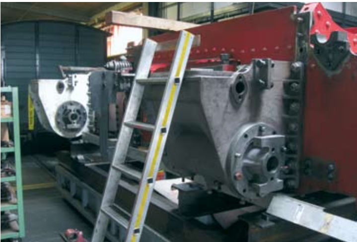
Blick auf das Mallet-Fahrwerk mit den bereits montierten Zylindern: Nach und nach werden weitere Kleinteile ergänzt und montiert.