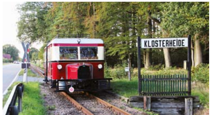
Nach der Sonderfahrt zum Jubiläum der EF Hannover war auf der Dienstfahrt nach Heiligenberg Zeit für einen Fotohalt am Hp Klosterheide – mit Dank an Tf Elmar Böcker.