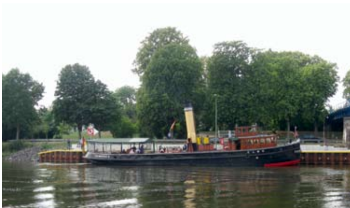
Über mehrere Tage aus Hamburg angereist war der Dampf-Eisbrecher „Elbe“, der ab Hoya kurze Ausflugsfahrten unternahm. Hoya, 2. August 2019.