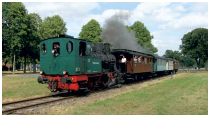
Am 4. August zog die VBVLok planmäßig einen Personenzug mit den VBV-eigenen „Preußenwagen“ über den Marktplatz Bruchhausen-Vilsen.