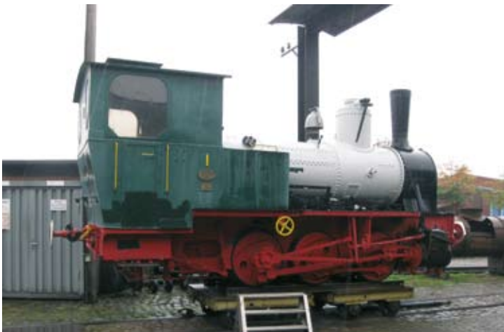
Bei der Denkmallokomotive JOHANN REINERS sind die maroden Verkleidungen an Kessel und Zylinder entfernt und der Kessel grundiert. Bruchhausen-Vilsen, 27. September 2019.