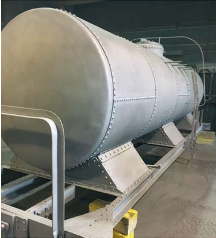
Am 20. September war der Kesselwagen DEV-152 in einem Fachbetrieb in seine Hauptkomponenten zerlegt und frisch sandgestrahlt.