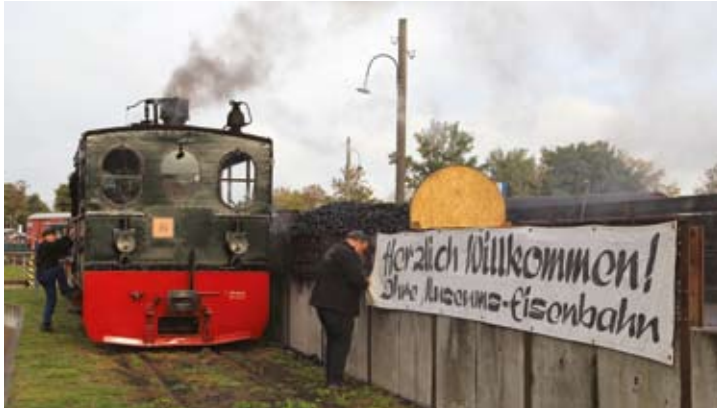
„Herzlich Willkommen“ hieß es am Maustag bei der Museums-Eisenbahn für alle Kinder und ihre Eltern. Die PLETTENBERG wurde am Kohlenbansen versorgt für den Betriebstag.