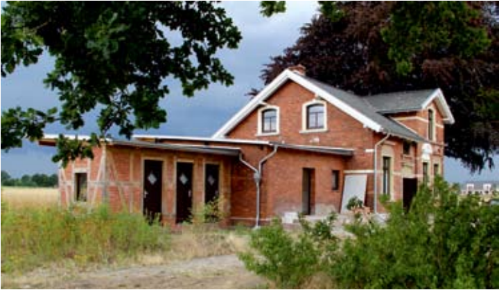
Von der Straßenseite her präsentierte sich der Ostbahnhof Maidamm (ObaMa) schon in fast fertigem Zustand zum Tag der offenen Tür.