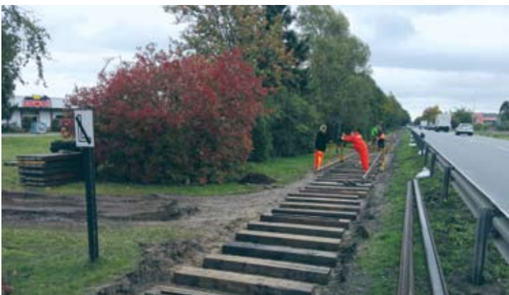
Zwei Tage später waren der Unterbau vorbereitet und alle Schwellen ausgelegt. Jetzt mussten die Schienen wieder aufgelegt werden. Asendorf, 11. Oktober 2019.