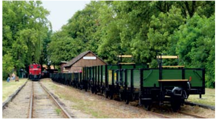
Mittagspause mit der Fotofahrt im Bf Heiligenberg: Links V 3 „Ziehittel“ mit dem OEG-Personenzug, rechts die Reihe der zehn offenen OEG-Güterwagen von Wim Pater. 1. August 2019. Foto: RM