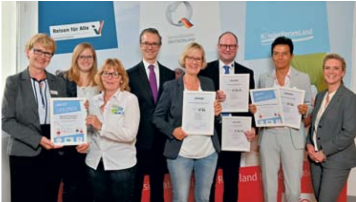
Übergabe der Urkunden zur Anerkennung als „KinderFerienLand Niedersachsen“ u. a. an Vertreterinnen der Museums-Eisenbahn und Samtgemeinde Bruchhausen-Vilsen (links).