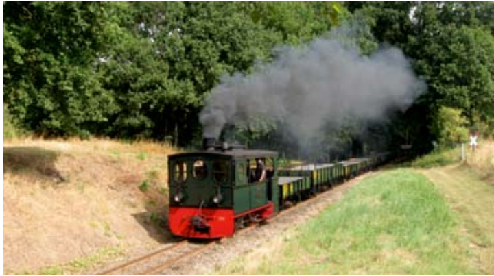
Erstmals im Foto-Einsatz: O-Wagengarnitur vorm. OEG der Kleinbahn Service B. V. hinter der passenden Kastendampflokomotive PLETTENBERG. Vilser Holz, 1. August 2019.