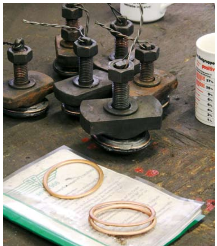
Bei der Vorbereitung der FRANZBURG für die Tage des Eisenbahnfreundes entstand ein Foto des „Stilllebens mit Waschlukenpilzen“ auf der Werkbank. Bruchhausen-Vilsen, 27. Juli 2019.