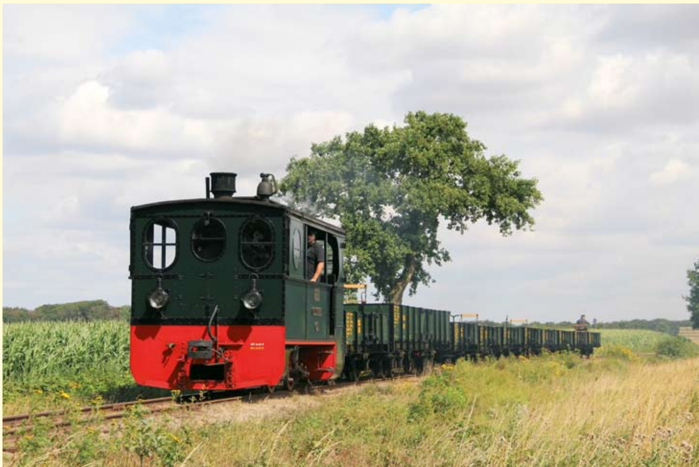
OEG-Fototag zu den Tagen des Eisenbahnfreundes: Lok PLETTENBERG mit den offenen OEG-Wagen von Wim Pater in der Heiligenberger Kurve. 1. August 2019.