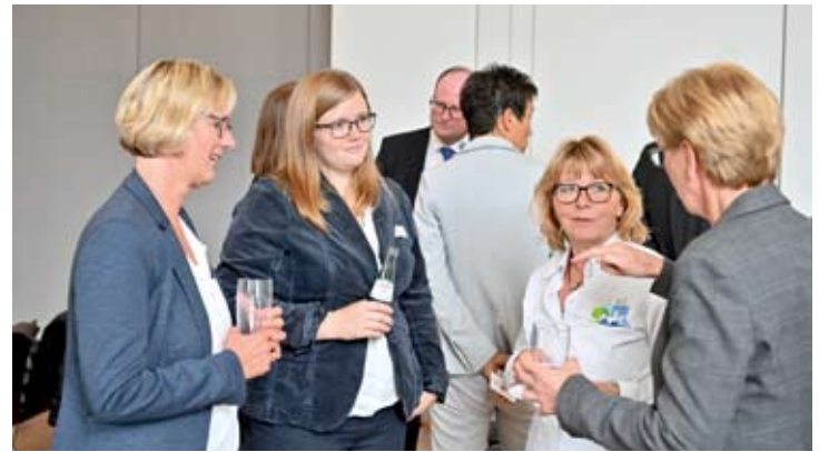
Vertreterinnen der Museums-Eisenbahn und der Samtgemeinde Bruchhausen-Vilsen im Gespräch auf der Verleihung. Hannover, 5. September 2019.