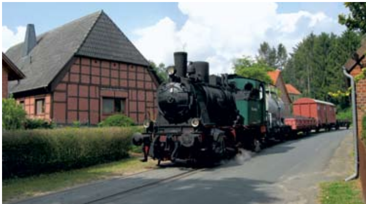
Foto-Güterzug auf der VGH-Strecke mit Gastdampflokomotive Nr. 2 BRAUNSCHWEIG des Vereins Braunschweiger Verkehrsfreunde (VBV) in der Ortsdurchfahrt Uenzen. 2. August 2019.