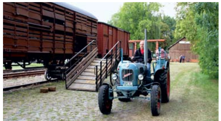
Vorkriegszeit am Samstag, Nachkriegszeit am Sonntag: In Heiligenberg brachten die Traktoren der AG Alteisen aus Asendorf Bewegung an der Ladestraße. 14. bzw. 15. September 2019.