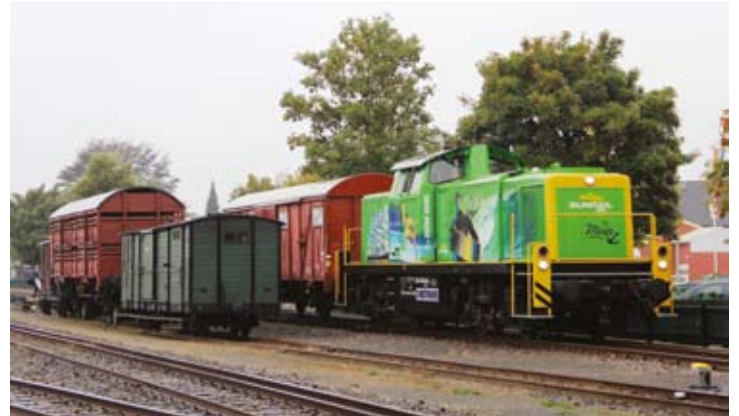
Am „Maustag“ ebenfalls zu Gast: SUNRAIL-Lok 291 038 „Der GRÜNE ENGEL“, mit der Lokführer Eike Rathjen am 4. Oktober im Bf Bruchhausen-Vilsen rangierte, bevor es wieder zurück nach Hamburg ging.