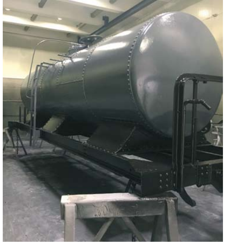
Am 30. September war der Kesselwagen bereits grundiert und lackiert und strahlt in neuem Glanz.