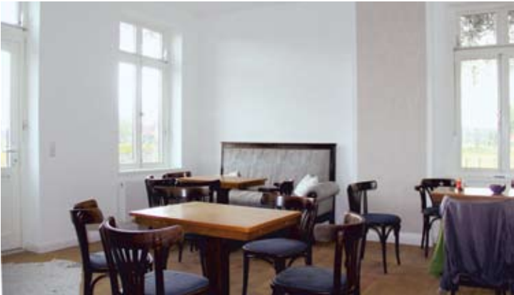
Im künftigen Speise- und Aufenthaltsraum des Gästehauses „Villa Gleisbett“ wurde schon einmal Kaffee serviert – sehr zu empfehlen! 20. Juli 2019.