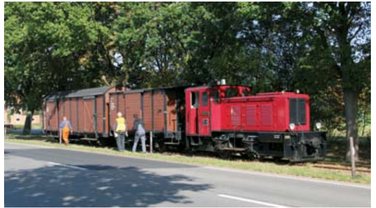
Zum Mittagessen am ersten Tag des Gleisbaumeetings ging es per Kleinbahn: Mit V 4 EMDEN kamen die DEV-Aktiven, Aufenthaltswagen 144 und Rottenwagen 145 nach Asendorf. 7. Oktober 2019.