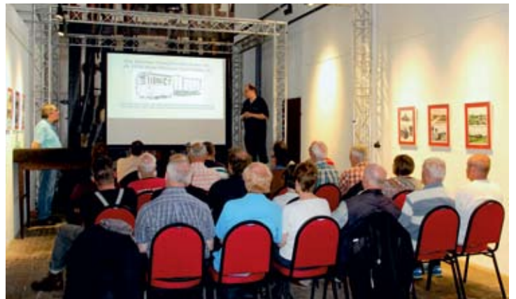
Kleinbahnvortrag im „Alten Gaswerk“ Bruchhausen-Vilsen: Thema war diesmal die Dürener Dampfstraßenbahn AG und ihre Nachfolgerunternehmen. 3. August 2019.