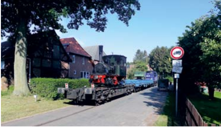
Mit Fahrzeugen von PRESS und METRANS wurde Dampflok FRANZBURG am 24. Mai zu einer Ausstellung zur Rügenschens Bäderbahn überführt, hier in der Ortsdurchfahrt Uenzen.