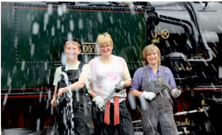
Ein bisschen Spaß darf auch sein: Das kühle Naß aus dem Schlauch eignet sich nicht nur zur Lokwäsche.