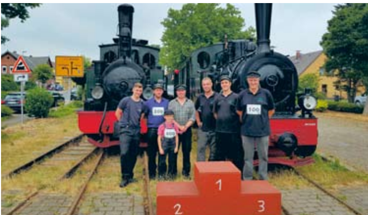
Auf das Siegetreppchen in Asendorf schaffte es der DEV auch dieses Jahr nicht, dennoch gibt es Gruppenfoto der beteiligten Aktiven.