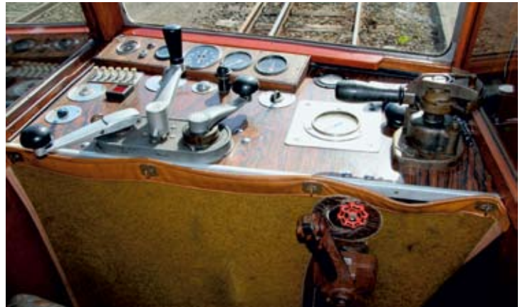
Blick in den Führerstand des T44 mit all seinen Hebeln, Schaltern und Kontrollanzeigen.