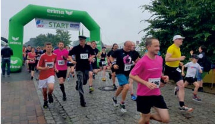
Am 10. Juni 2018 fand trotz Regenwetter erneut der Wettlauf „Tagen des Eisenbahnfreundes“ statt. Die Läuferinnen und Läufer kurz nach dem Start.