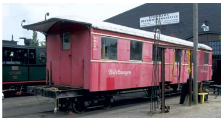
Wagen Nr. 7 ist zur Substanzdokumentation teilzerlegt und für die Abnahme des Wagenkastens vorbereitet, der extern erneuert werden wird. Bruchhausen-Vilsen 21. Juli 2018, Foto: DM