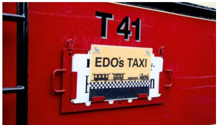
T41 brachte die Staffelläufer wieder zurück und hieß in Erinnerung an den verstorbenen Initiator Edo Christophers „Edo's Taxi“.