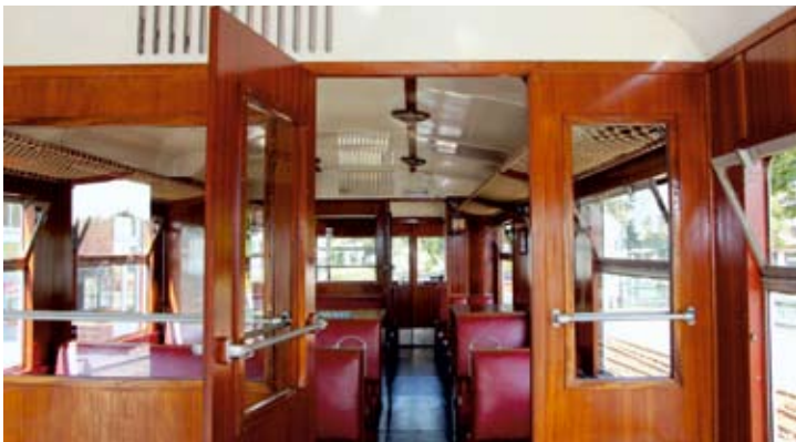
Blick aus dem Gepäckabteil in den Fahrgastraum des T44: Eleganz der 1950er Jahre!