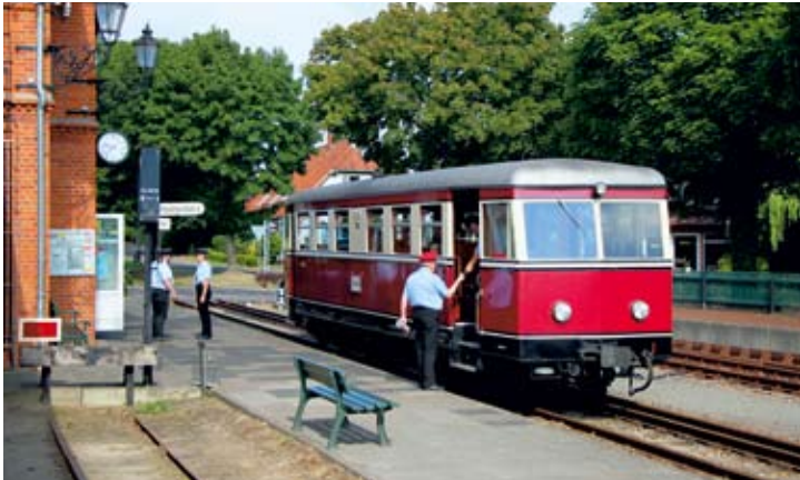
Der Sondertriebwagen T44 steht gegen 9:40 Uhr anlässlich „800 Jahre Kloster Heiligenberg“ zur Abfahrt am Bahnsteig bereit.