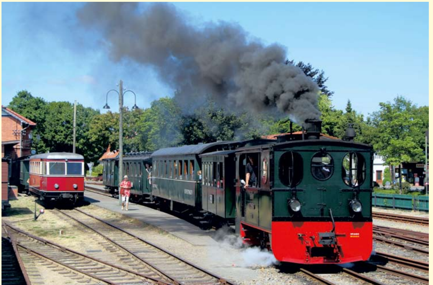
Am 7. und 8. Juli verkehrte neben dem planmäßigen Dampfzug noch ein Sondertriebwagen anlässlich „800 Jahre Kloster Heiligenberg“: Abfahrt der PLETTENBERG vom Bahnhof Bruchhausen-Vilsen Richtung Asendorf, während der T44 noch ein wenig Pause hat. 8. Juli 2018