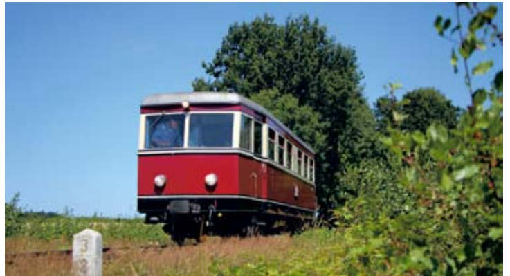
In der Heiligenberger Kurve wurde ein Fotohalt mit T44 am Kilometerstein 3,2 eingelegt. 7./8. Juli 2018.