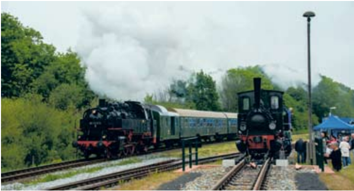
In Putbus blieb die FRANZBURG mangels Meterspurgleisen auf ihrem Transportwagen stehen, dahinter fährt 86 1333-3 mit einem Sonderzug aus Bergen ein.