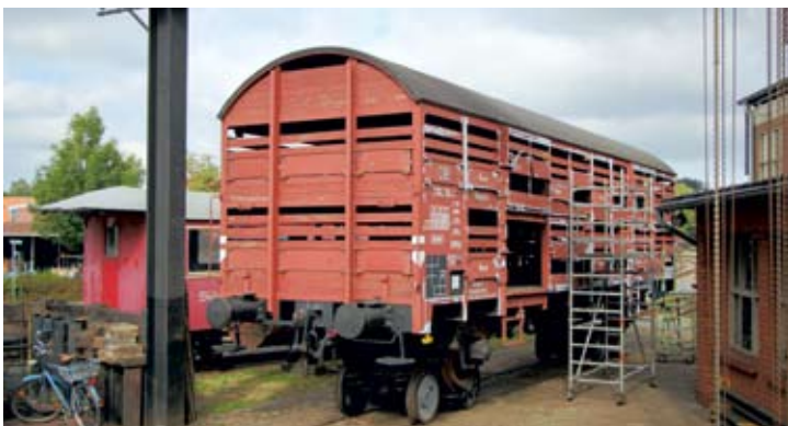
Aktiv-Ferien bei der Museums-Eisenbahn: Die Jugendlichen hatten sich des Gw 8 angenommen und bereits Rostschutz aufgebracht. Bruchhausen-Vilsen, 14. Juli 2018