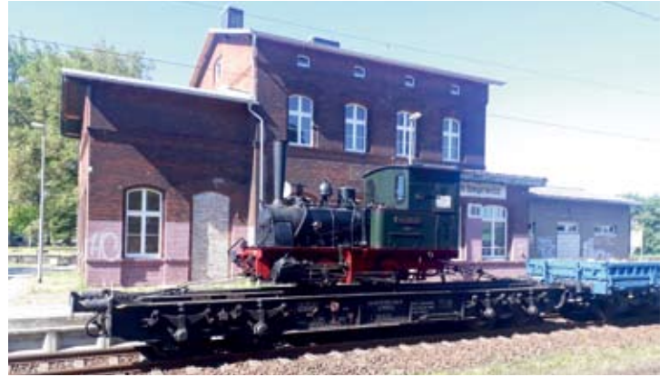
Ganz nahe an der alten Wirkungsstätte war die Lok in Ribnitz-Damgarten Ost, wo einst ihre Einsatzstrecke der Franzburger Kreisbahnen begann.