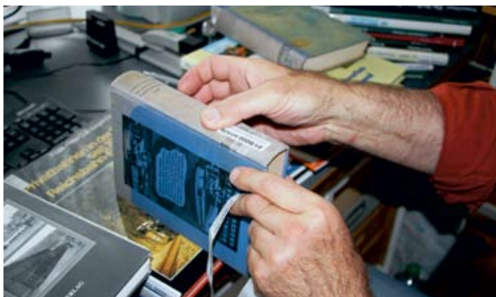
Die Etiketten werden auf die Bücherrücken geklebt, damit die Bücher in der Kleinbahn-Bibliothek künftig schnell zu finden sind.