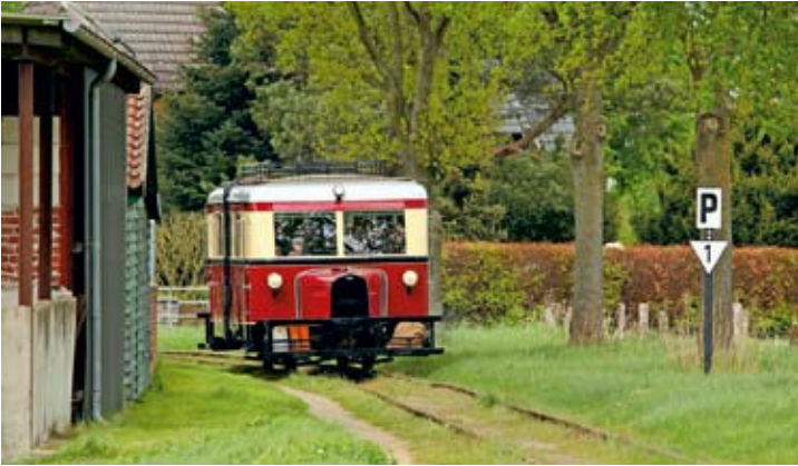
Triebwagen T 41 im Einsatz anlässlich der Saisonöffnung am 1. Mai am Bahnübergang Bollenstraße.