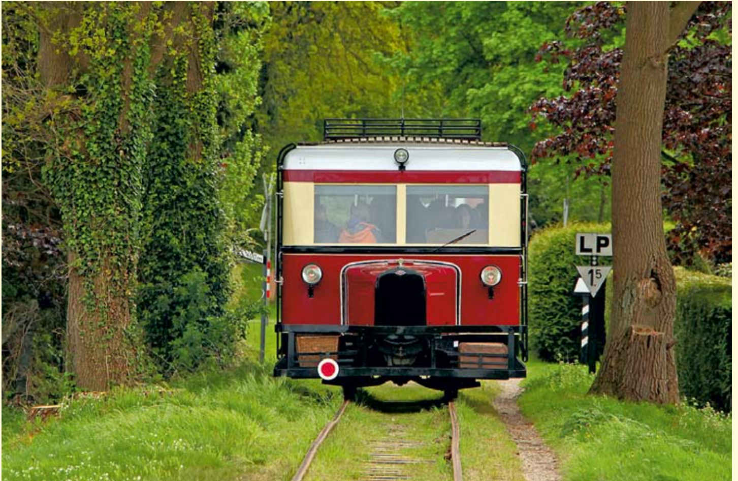
Nach dem langen, heißen und trockenen Sommer vermisst man es schon fast, das frische Frühlingsgrün, durch das der Wismarer Schienenbus T 41 am 1. Mai Richtung Asendorf fuhr. Hier ein Nachschuss, kurz vor dem Bahnhof Vilsen Ort. 1. Mai 2018