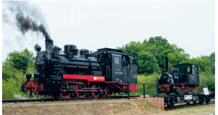
Zwei bekannte Lenz-Typen treffen aufeinander 99 4633-6 (vorm. RüKB 53 Mh, 750 mm) und FRANZBURG (vorm. FKB 4i, 1000 mm). 27. Mai 2018.