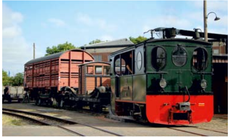
Bereits vor 9 Uhr wurde mit der PLETTENBERG rangiert: Der aufgebockte Gw 8 wurde in die Nähe der Fahrzeughalle gebracht, um während der Schulfereien durch die Jugendgruppe aufgearbeitet zu werden.