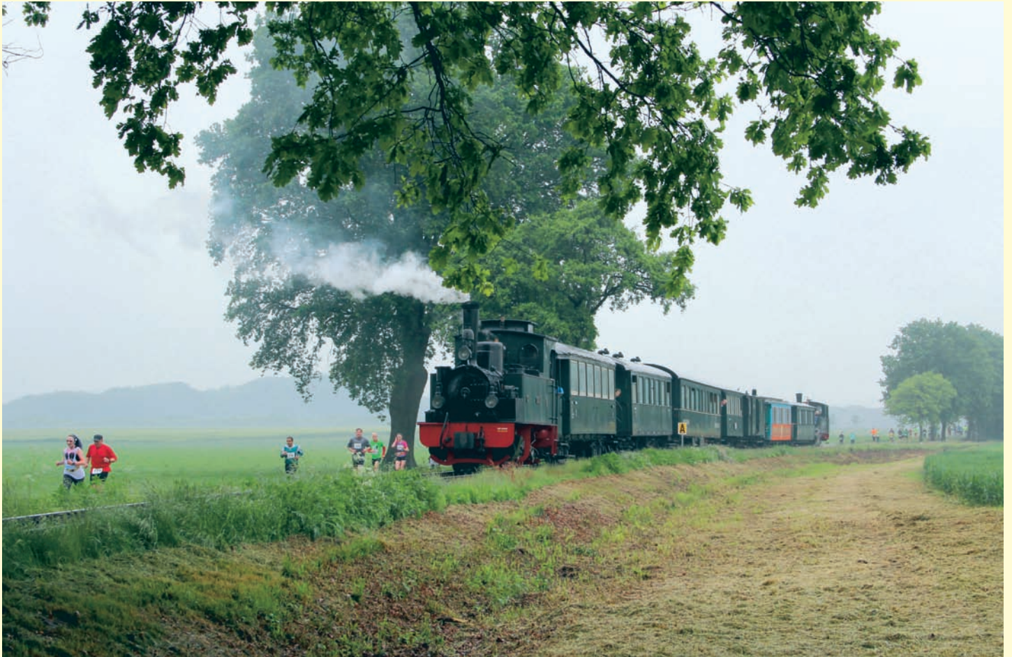
Trotz widriger Witterungsumstände fanden sich zahlreiche Läuferinnen und Läufer ein, die beim Wettkampf „Mensch gegen Maschine“ gegen die Museumsbahn antraten. Heiligenberger Kurve, 29. Mai 2016, Foto: Regine Meier