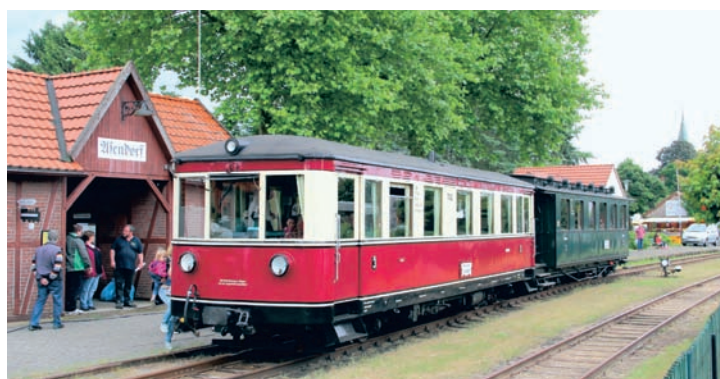
Am Sonntagabend verkehrte der ex FKB-Triebwagen T42 zusammen mit dem ebenfalls Lenz'schen Personenwagen Nr. 17. Asendorf, 19. Juni 2016