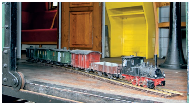
Der 18. Juni 2016 stand als „FKB-Wochenende“ ganz im Zeichen der Lenz'schen Franzburger Kreisbahnen und den beim DEV erhaltenen Fahrzeugen und ihren Kleinstserienmodellen im Gartenbahnmaßstab. Bruchhausen-Vilsen