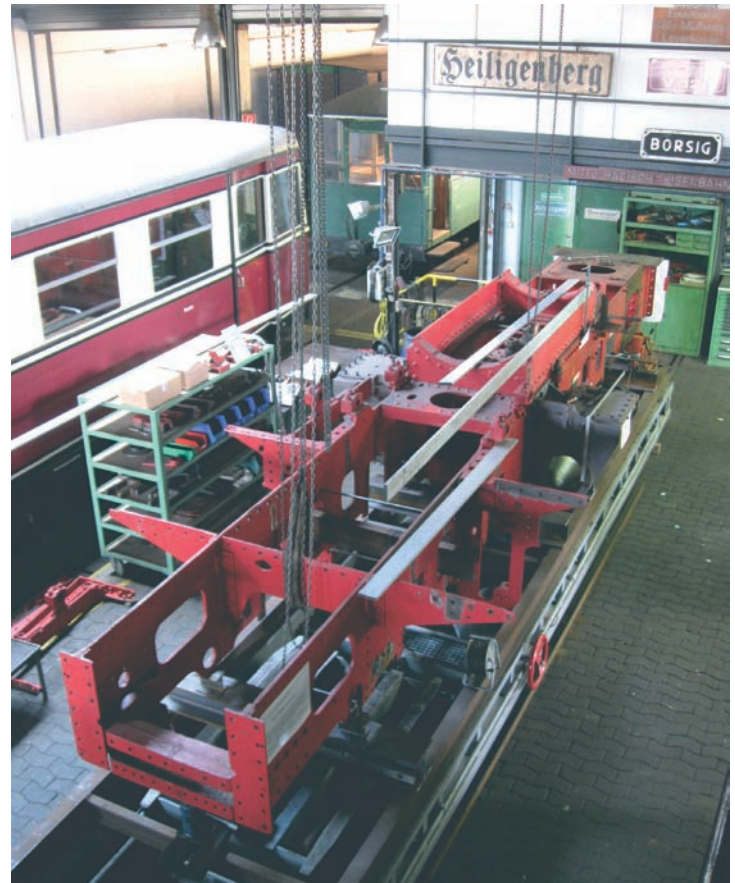
Zur Ausstellung und zugleich zum Richten befinden sich die Rahmen der Malletlok 7 s auf Rollwagen Nr. 177 in der Werkstatt. Bruchhausen-Vilsen, 2. Juli 2016