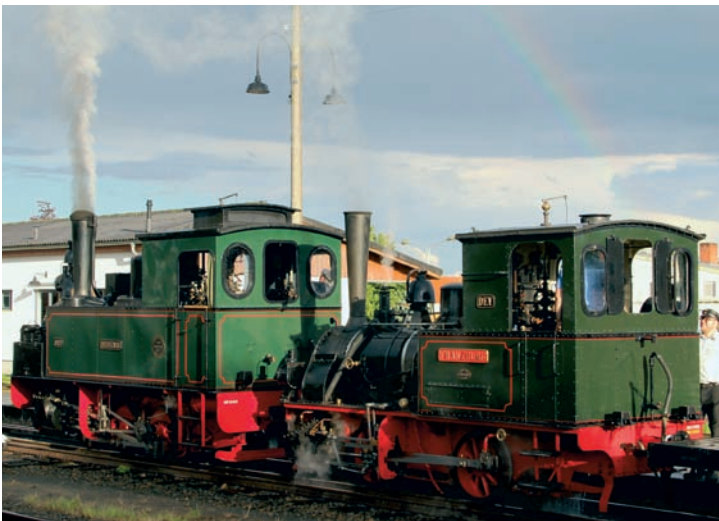
Am 2. Juli 2016 widmete sich das Kleinbahnmuseum mit „Vereinshistorischen Zugbildungen“ der Eigengeschichte mit Zügen wie dem „Graf von Hoya“. Für die Zeitreise rund 30 Jahre zurück brauchte es aber keinen DeLorean DMC-12 mit Fluxkompensator und Mr. Fusion: HERMANN und FRANZBURG wurden kurzzeitig einfach wieder mit dicken Zierlinien aus den 80ern versehen und fahren gleich unter einem Regenbogen aus Bruchhausen-Vilsen aus.