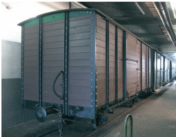
Mit großen Schritten geht der nun verbretterte Gepäckwagen Nr. 51 seiner Fertigstellung entgegen. Bruchhausen-Vilsen, 2. Juli 2016