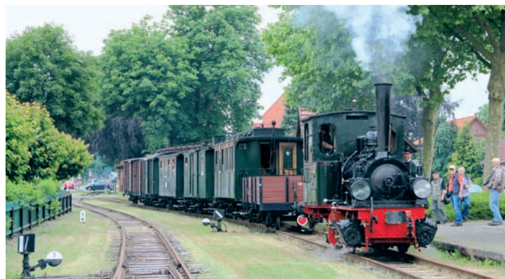
Der FKB-Güterzug mit Personenbeförderung, verstärkt um den ebenfalls mit Görlitzer Gewichtshebelbremse ausgestatteten Salonwagen Nr. 13. Asendorf, 18. Juni 2016, Foto: Regine Meier