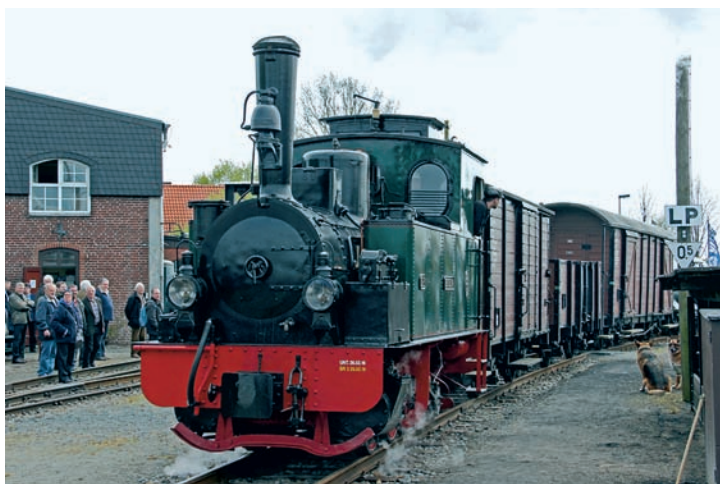
Vielbeachteter Erstauftritt von HERMANN nach achtjähriger Restaurierungspause am Bahnhof Bruchhausen-Vilsen, 1. Mai 2016, Foto: Martin Kursawe