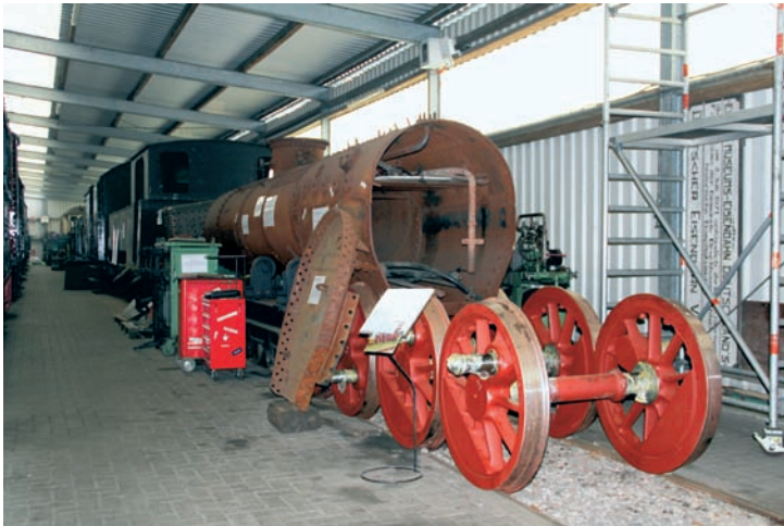
Viele andere Teile der Mallet sind bereits auf- oder angearbeitet oder erneuert worden. Die Ausstellung erläutert die Bauteile und den Baufortschritt. Bruchhausen-Vilsen, 16. Juni 2016, Foto: Regine Meier