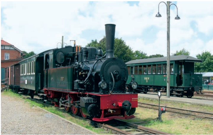
Am 2. Juli 2016, auf den Tag genau 50 Jahre, nachdem der erste Museumszug nach Heiligenberg seine Fahrt aufnahm, stand der Eröffnungszug, bestehend aus Dampflok HOYA (in Vertretung der unpässlichen BRUCHHAUSEN) und Personenwagen 14, am Bahnhof Bruchhausen-Vilsen ausgestellt.