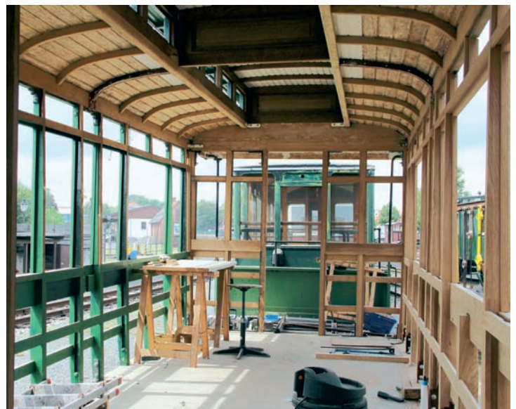
Wagen Nr. 16 und 22 machen zwar gegenwärtig keine großen Fortschritte, wurden aber dafür zu Abwechslung mal ans Tageslicht rangiert. Bruchhausen-Vilsen, 16. Juni 2016, Foto: Regine Meier

Die weiteren Arbeiten am hölzernen Wagenkasten des Weyer-Personenwagen DEV-Nr. 16 ruhen gegenwärtig. Das ist leider erforderlich, weil wir uns entschlossen haben, dass unser Tischler Klaus Schmidt zunächst die erforderlichen Restarbeiten am Gepäckwagen Nr. 51 ausführt, damit dieses Projekt in absehbarer Zeit abgeschlossen werden kann.