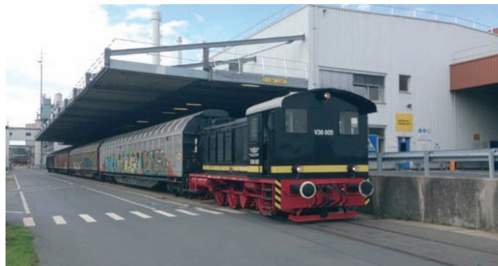
V36 005 bei der Abnahmefahrt auf dem Gelände der Kartonfabrik Smurfit Kappa in Hoya. 12. Juli 2016, Foto: Hans-Peter Kempf

Am 12. Juli 2016 konnte die seit Anfang Januar diesen Jahres durchgeführte Hauptuntersuchung an unserer normalspurigen Diesellokomotive V36 005 erfolgreich abgeschlossen werden. Die Lok steht jetzt wieder für Einsätze innerhalb und außerhalb der VGH-Strecke zur Verfügung. Die erforderlichen Arbeiten wurden von den DEV-Aktiven mit Unterstützung der VGH-Werkstatt in der Fahrzeughalle in Hoya ausgeführt. Neben den Einsätzen bei den diesjährigen DEV-Jubiläumsveranstaltungen auf der VGH-Strecke liegen auch bereits Anfragen für Einsätze der Lok in Harpstedt und in Hamburg vor.